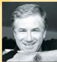
אהוד מנור חתן פרס ישראל

כתיבה, בימוי וכוריאוגרפיה: עופר שפיר מילות השירים: אהוד מנור ניהול מוסיקלי ועיבודים: אמיר לקנר